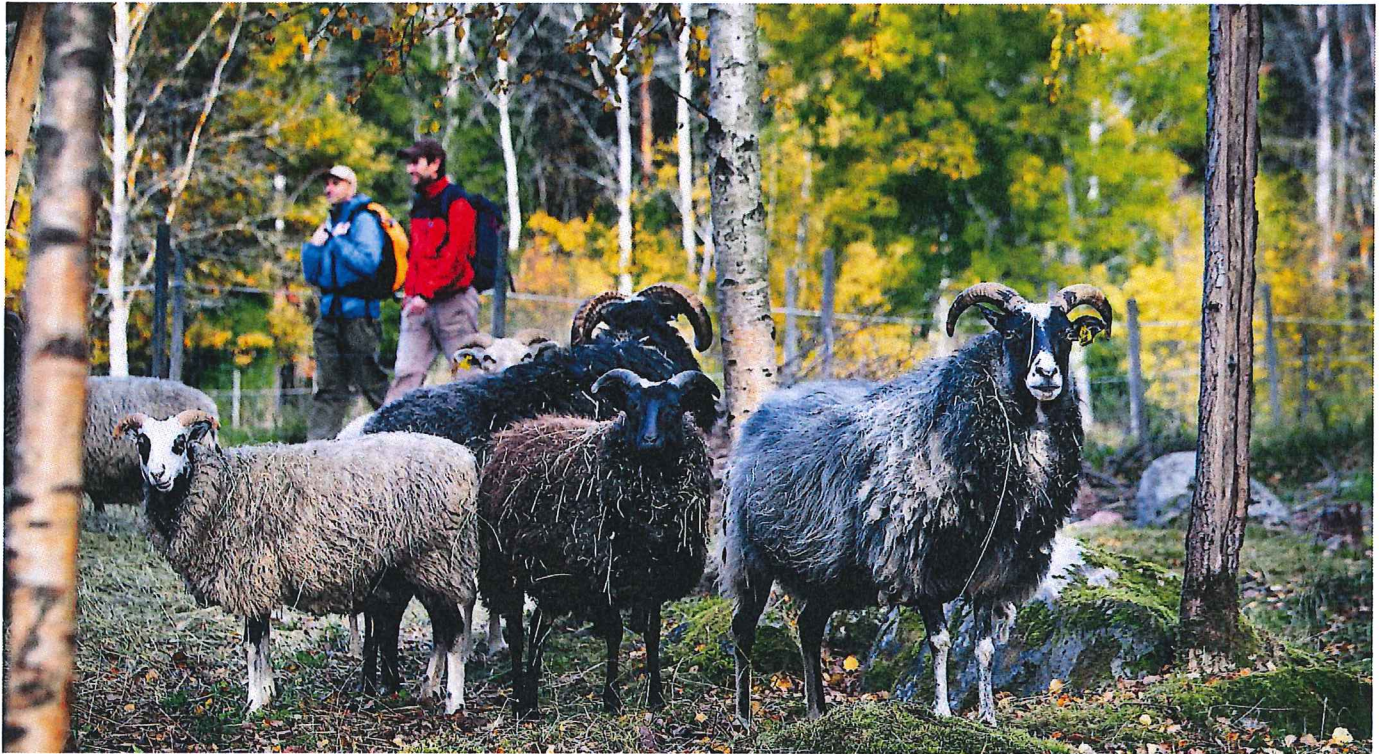
Bullerbydillen Nyby bjuder på betande får och faluröda stugor. Här kan man som vandrare dessutom övernatta och få nybakat bröd till frukost. Föregående sida: Roslagsleden från Grisslehamn går nära Albert Engströms ateljé, som ligger direkt på klipporna.