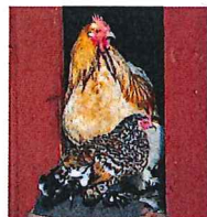
Höns på Väddö gårdsmejeri.

Leden är indelad i elva rekommenderade dagsetapper. Den kortaste är nio km lång, den längsta 25 km. Med tanke på allt som finns att se; räkna med en vandringstakt på ca 5 km i timmen, om du ogillar att svettas. Det finns en tryckt guide med karta att köpa.